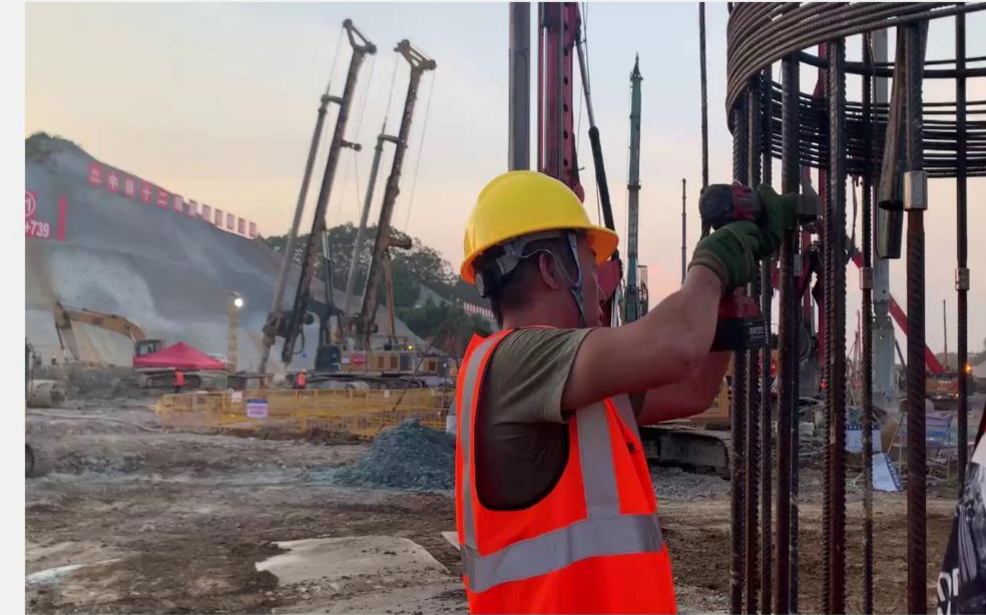
手动扳手 拧紧视频