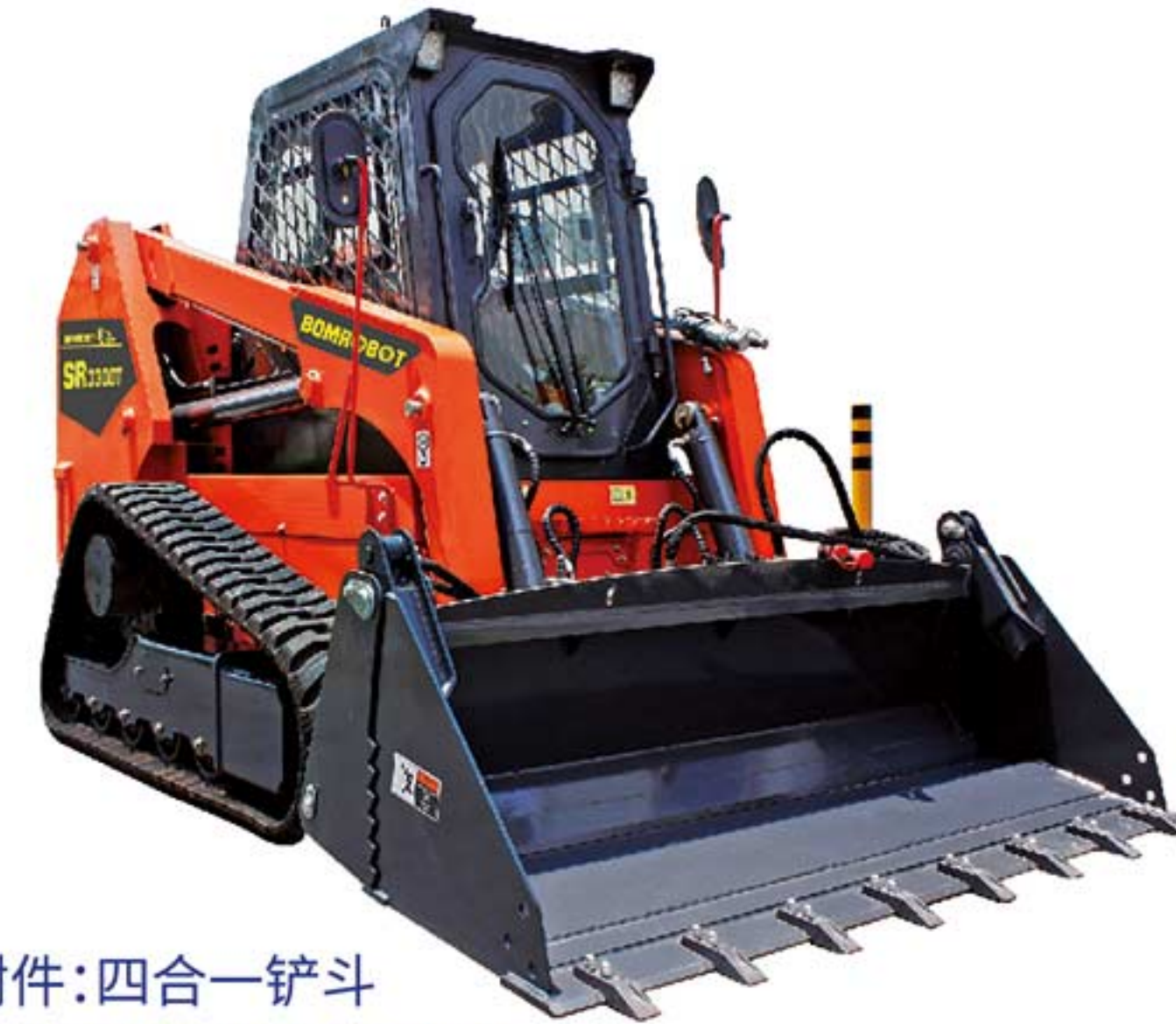
所示附件:四合一铲斗 Attachment: 4 in 1 bucket

The SR3300T has the maximum load of the current slip transfer loader.