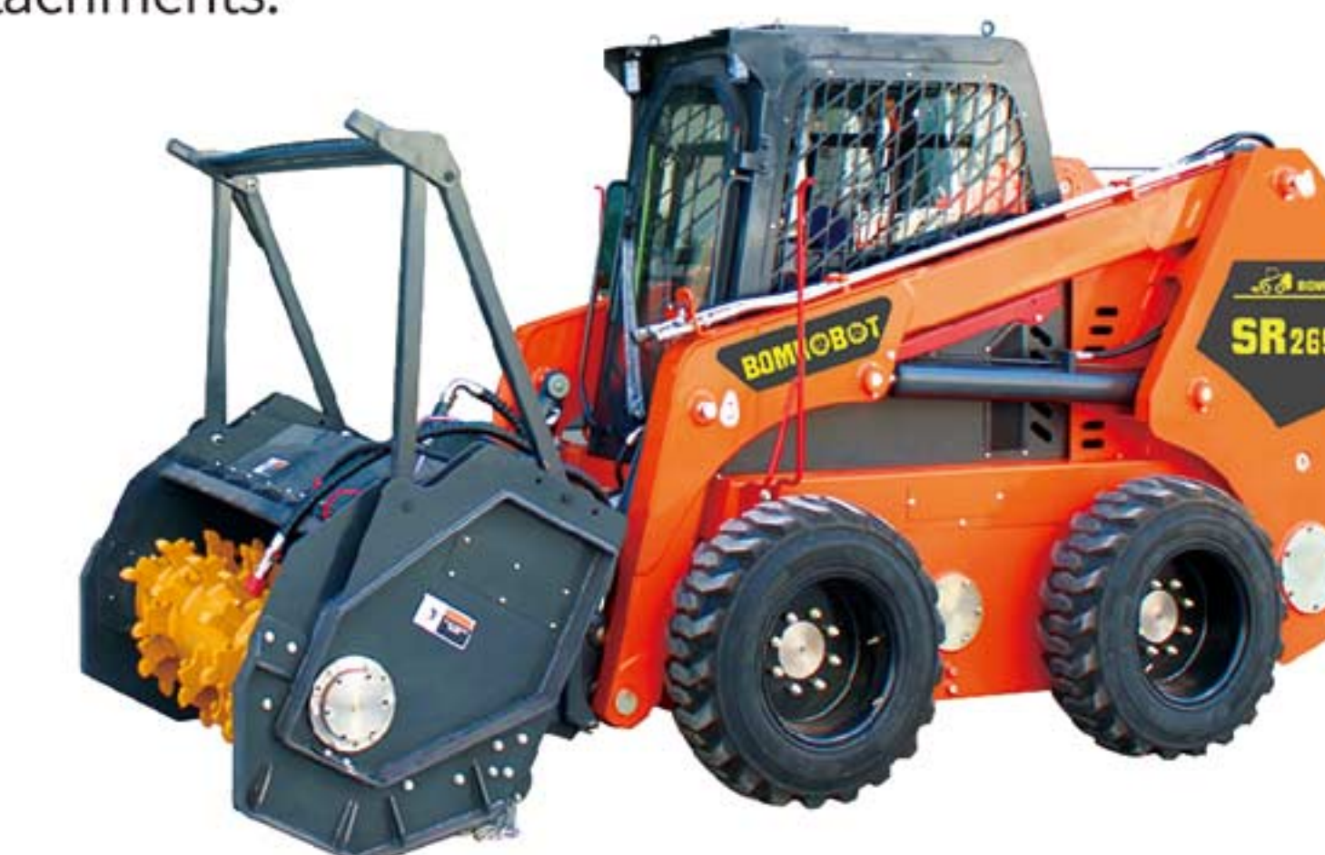
所示附件:拓荒机 Attachment: Forestry mulcher

More powerful lifting capacity, and standard high-flow oil-supply interface, is the standard for some large-scale attachments.