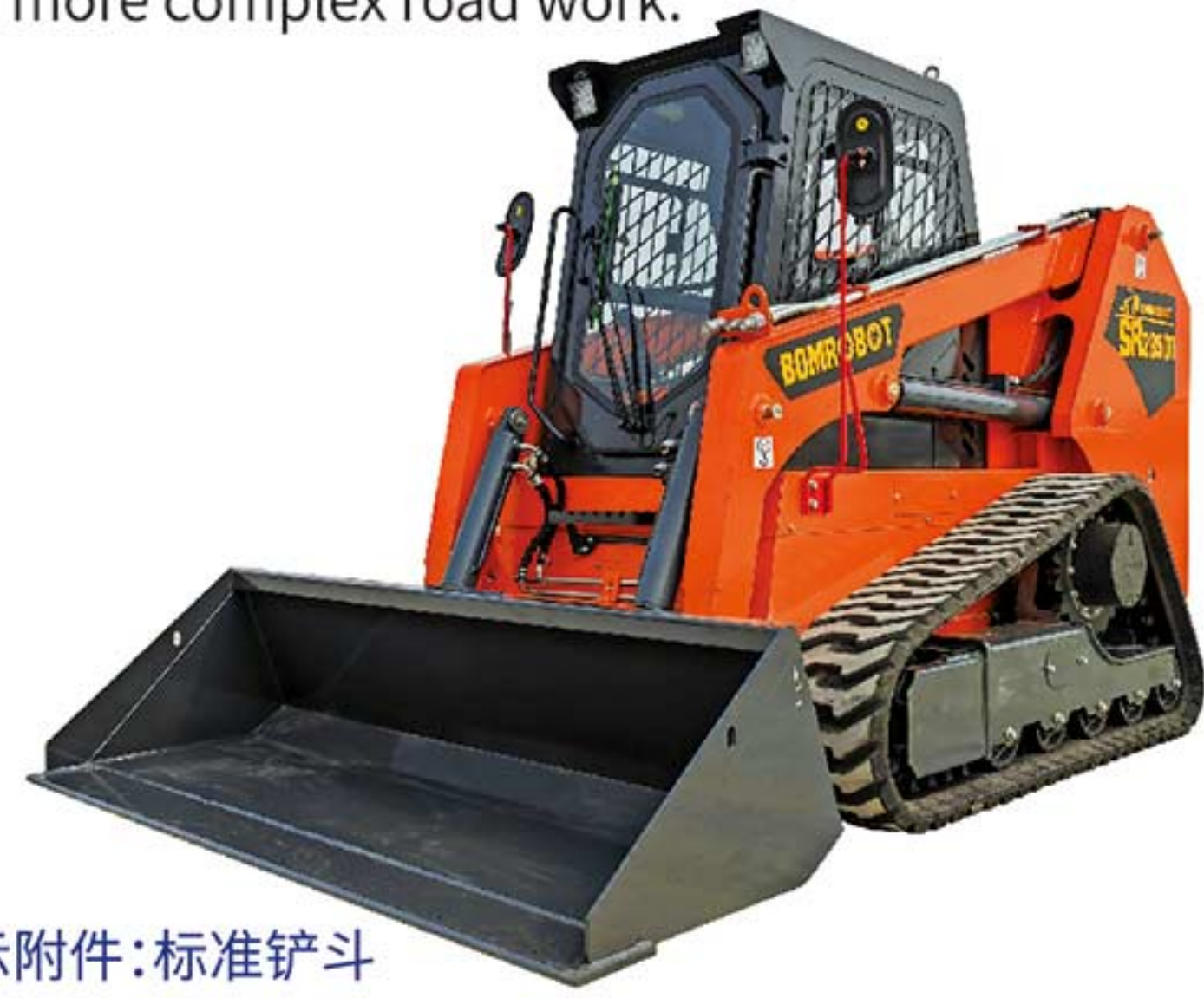
所示附件:标准铲斗 Attachment: Bucket

The SR2850T has a crawler chassis for greater traction and more complex road work.