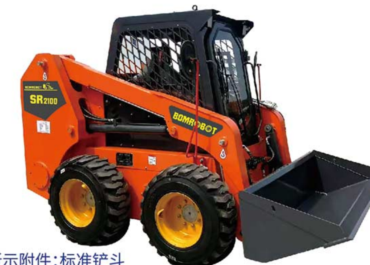
所示附件:标准铲斗 Attachment: Bucket

Multiple configurations are available to fit most of the attachments on the market.