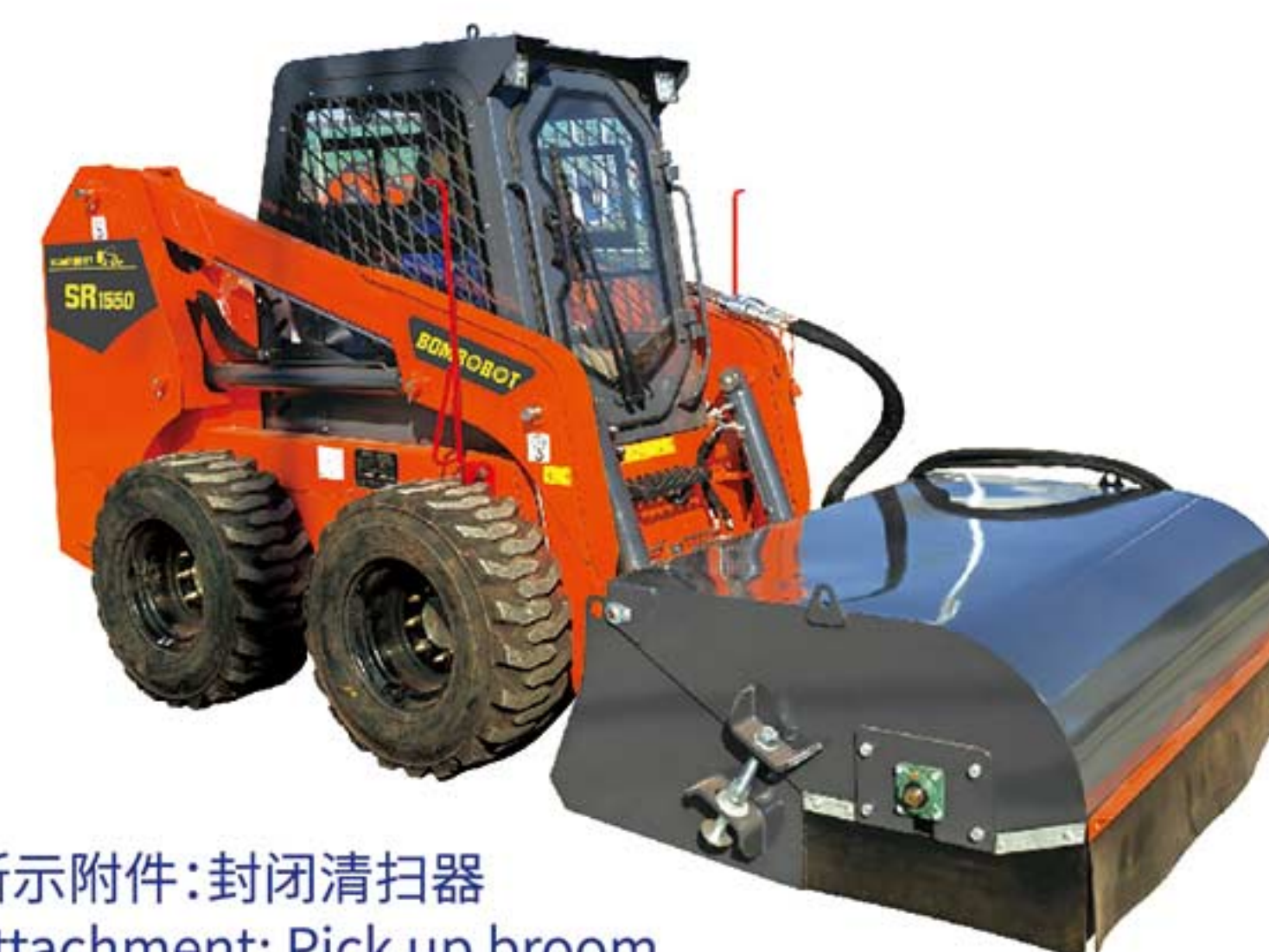
所示附件:封闭清扫器 Attachment: Pick up broom

It is small in size, flexible in operation, and equipped with sweeping attachments. It is a tool for sweeping the road.