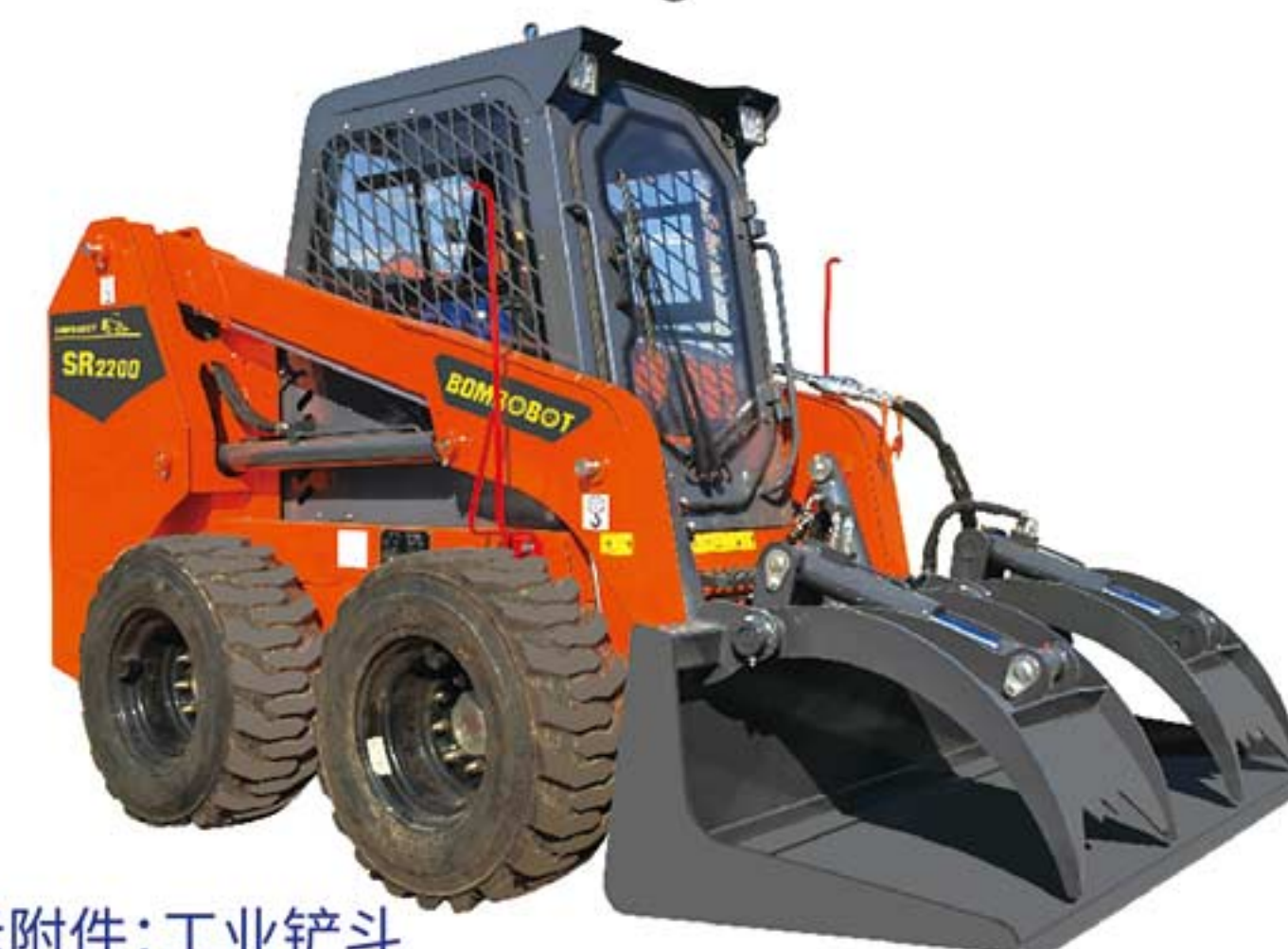
所示附件:工业铲斗 Attachment: Industrial bucket

The SR2200 is an upgraded version based on the SR2100. The control system is a pilot servo, which makes the operation more labor-saving and more efficient.