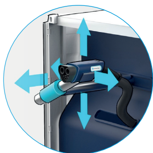
安装至自动连接系统的 MCS