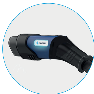
不带顶部手柄的型号