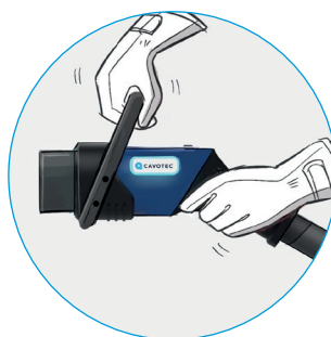
易于使用的双手柄