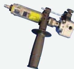
连接风动工具驱动