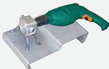
连接手枪电钻驱动