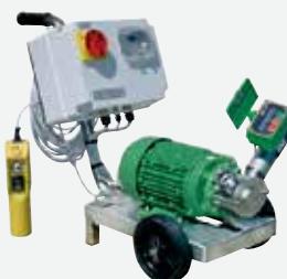
远程变频控制泵的流量