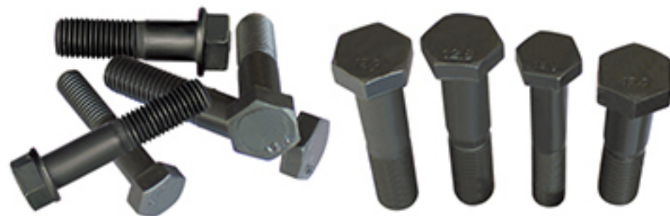
支重轮螺栓 Track Roller Bolt