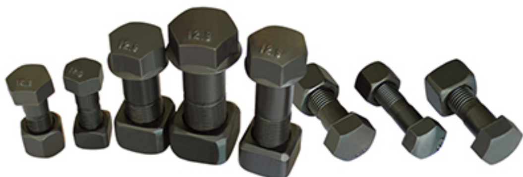
链板螺栓 Track Bolt and Nut