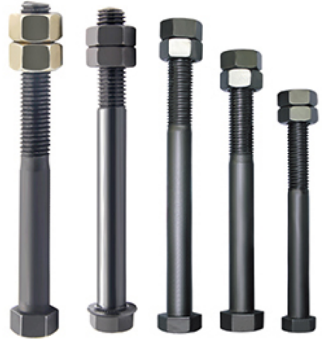
斗轴螺栓 Bucket Pin bolt