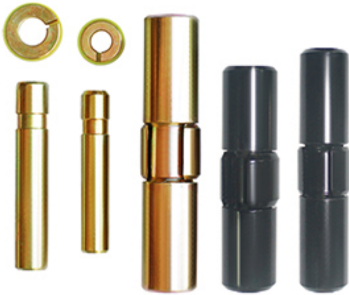
斗齿销 Tooth Pin