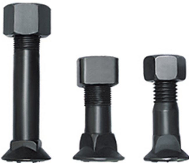
刀角螺栓 Plow Bolt