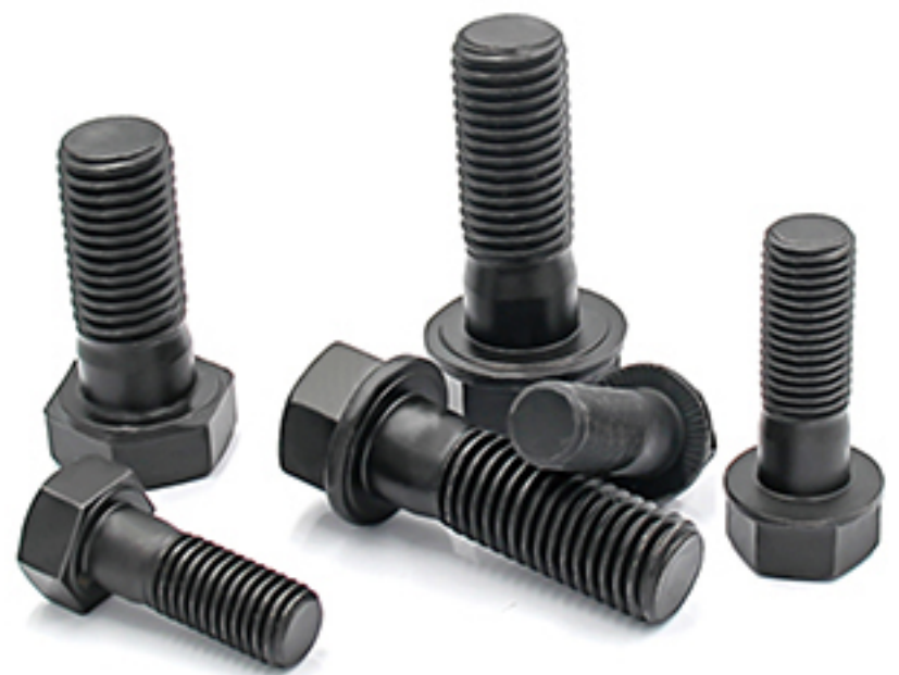
齿圈螺栓 Gear Ring Bolt